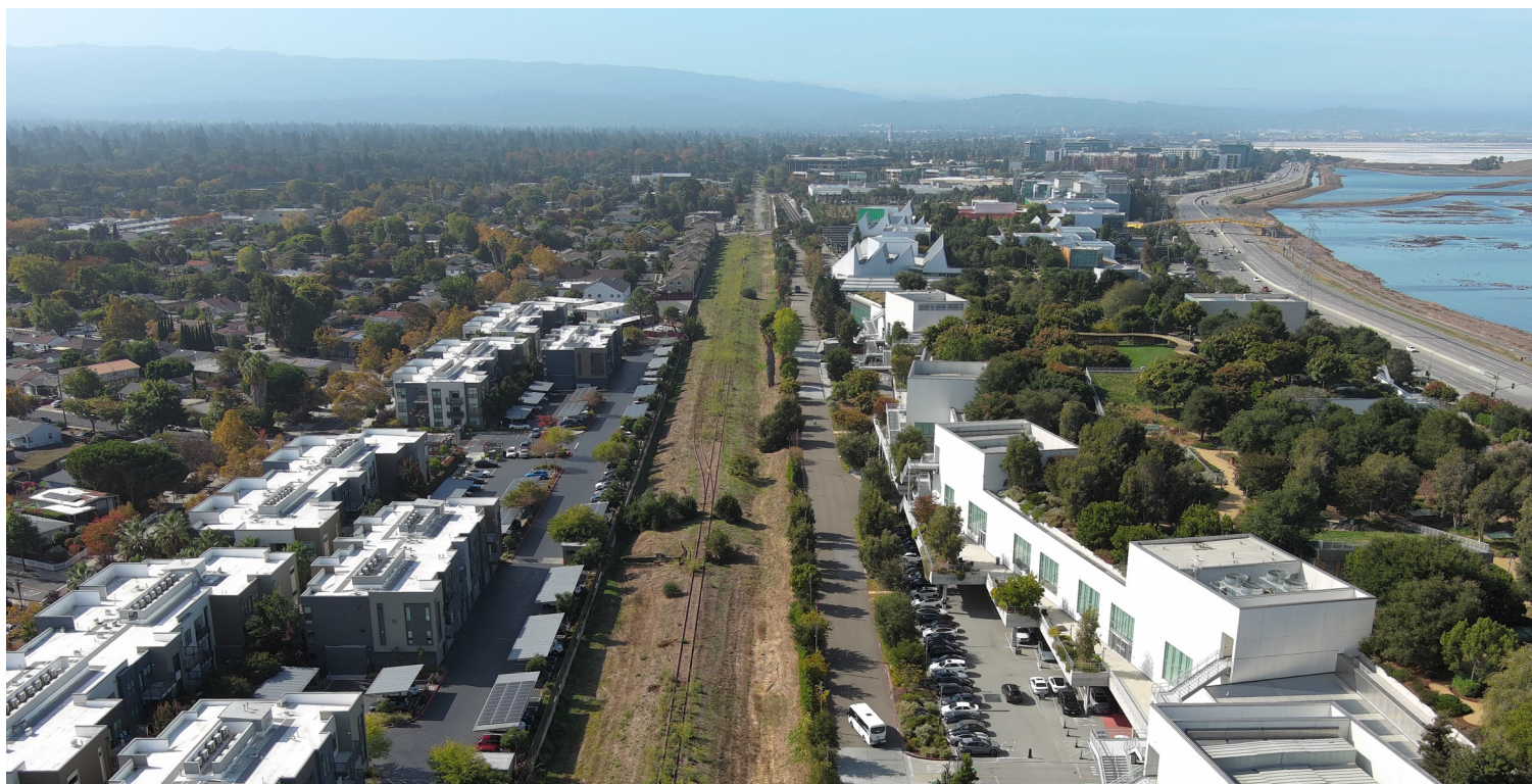
Estado del corredor de Dumbarton, 2025